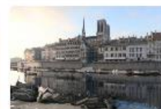
Animer les Journées de Patrimoine pour Kering Pour les Journées de Patrimoine de Blois, le 17 et 18 septembre 2017, le Musée de la Seine Normande.