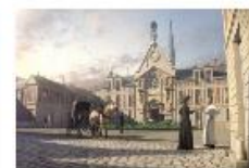
Animer les Journées de Patrimoine pour Kering Pour les Journées de Patrimoine de Blois, le 17 et 18 septembre 2017, le Musée de la Seine Normande.