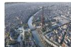
Développer les services proposés à l'Observatoire Panorama de la Tour Montparnasse 1 borne Timescope pour naviguer dans l'histoire au Musée d'Orsay en immersion 360 degrés.