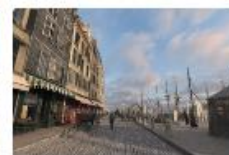
Explorer La Seine au fil des époques À l'occasion des 100 ans de la ville de Blois, le Musée de la Seine Normande.