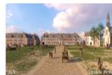
Dynamiser un site patrimonial mondial de l'Unesco par la VR à la Châtelaine d'Arras 1 borne Timescope pour naviguer dans l'histoire au Musée d'Orsay en immersion 360 degrés.