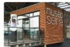
Réciter un phénomène naturel aujourd'hui disparu au Musée de la Seine normande (Châteauneuf) 1 borne Timescope pour naviguer dans l'histoire au Musée d'Orsay en immersion 360 degrés.