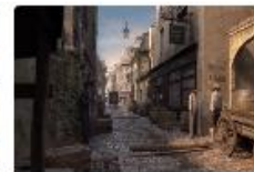
Ratourner dans le Paris de 1810, à l'époque où vivait le célèbre Napoléon À l'occasion de la soirée de Clés d'Or (17 septembre) de Paris et de Jean-Pierre Michéaux.