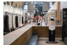
Des bornes comme outils de médiation au Musée d'Orsay 3 bornes Timescope pour naviguer dans l'histoire au Musée d'Orsay en immersion 360 degrés.

TOUT 1 - RECONSTITUTIONS HISTORIQUES 2 - FILMS 360° AUGMENTÉS 3 - PROJETS FUTURS