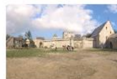
Raconter l'Histoire d'un site patrimonial au Château Royal de Blois 1 borne Timescope pour naviguer dans l'histoire au Musée d'Orsay en immersion 360 degrés.