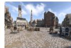
Révisiter l'Histoire de la Place des Mirrors d'Arras 2000 personnes ont pu profiter de l'histoire de la Place des Mirrors d'Arras.